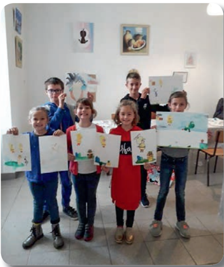
Séance peinture du 2 octobre 2019, les enfants montrent leurs réalisations.

Pour les adultes et les enfants, deux mercredis par mois, de septembre à mai. L'association met à disposition gratuitement ses fournitures de peinture aux enfants pendant toute la saison elle fait de même aux adultes qui souhaitent découvrir de nouvelles techniques sans avoir besoin au départ d'acheter leur propre matériel.