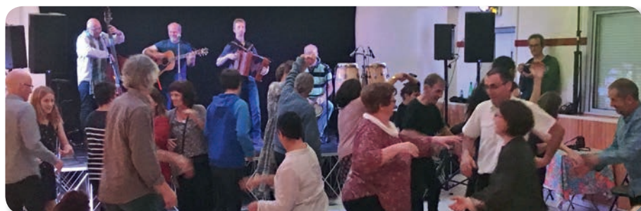
Bal Folk de novembre 2018