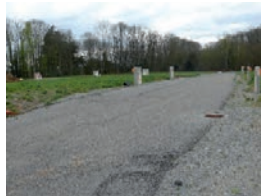
Lotissement en cours